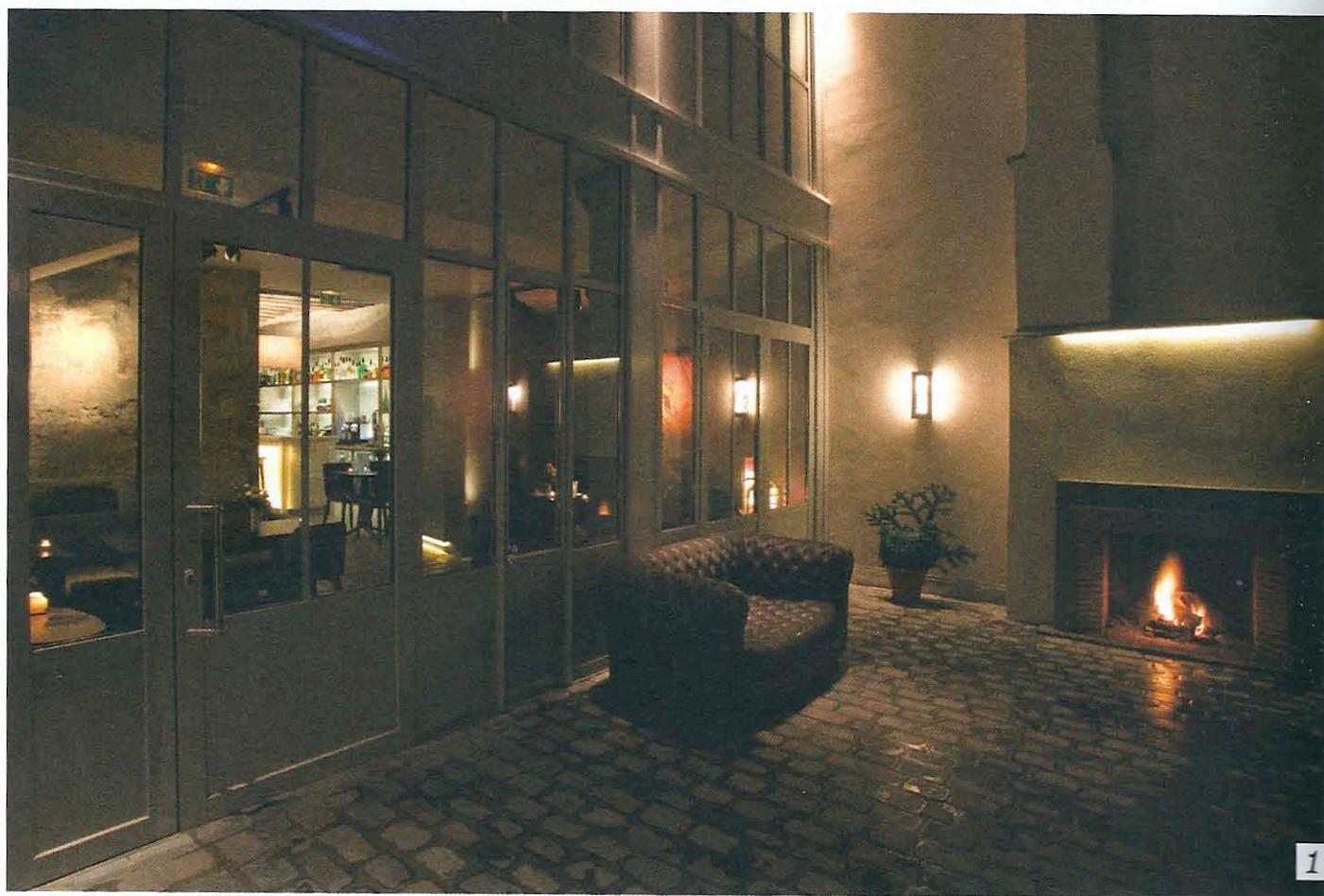
1/ Salon et cheminée extérieurs devant le bar en rez-de-chaussée de l'ancienne remise.

«Faire du plaisir des autres son métier» est une louable évidence partagée par tous les acteurs, personnel compris, de cet hôtel ambitieux sans être prétentieux! L.B.